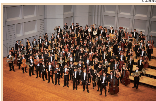
オーケストラ | 東京フィルハーモニー交響楽団 Tokyo Philharmonic Orchestra, orchestra