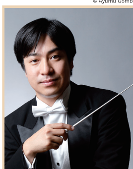
指揮 | 井田勝大 Katsuhiko IDA, conducting