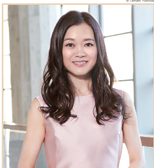
ゲストMC | 吉田 都

シリーズ第一弾は、英国のロイヤル・バレエ団で22年間にわたってプリンシパルをつとめ、現在、新国立劇場舞踊芸術監督の吉田都がゲストMCに登場。バレエの世界を彩る名曲の数々をお楽しみください。