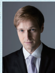
ヴィタリ・ユシュマノフ