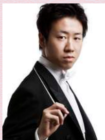
川瀬 賢太郎 (指揮)